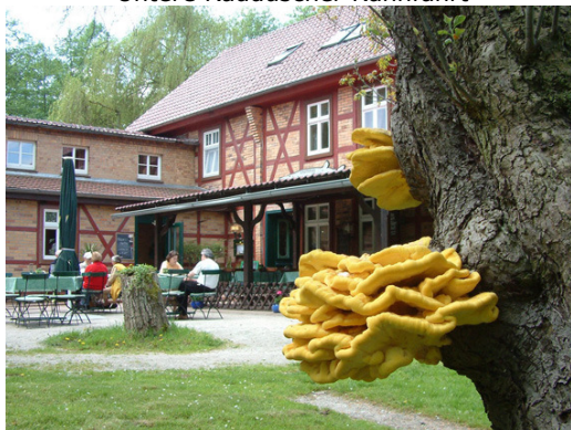
Dubkow - Mühle